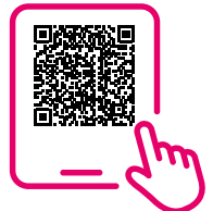
Abbildung „Humanitäre Logistik bis zur letzten Meile“